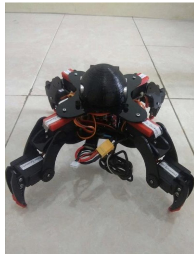
Gambar 3a. Robot quadruped tampak belakang

Pengujian sensor jarak ini dilakukan untuk mengetahui jarak yang akan dideteksi oleh sensor ultrasoniknya terhadap objek yang berada didepan. Sensor ultrasonik ini bekerja dengan cara memantulkan gelombang ultrasonik secara terus-menerus bila terdapat objek didepannya. Lalu gelombang ultrasonik akan memantul dan diterima oleh receiver sensor, setelah itu baru bisa jarak bisa didapatkan. Akurasi pada sensor ultrasonik dengan jarak sesungguhnya ini masih kurang tepat karena masih mendapatkan nilai yang error dan penampilan perubahan nilainya juga masih begitu sangat cepat berganti.