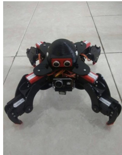
Gambar 3a. Robot quadruped tampak depan

Pada robot quadruped yang dirancang ini maka akan dilakukan pengujian untuk mengetahui kinerja dari sistem beserta dengan analisa yang telah diperoleh. Pengujian ini dilakukan dengan terpisah dan menyeluruh untuk memudahkan dan menganalisa dan menghindari adanya suatu kesalahan. Pada pengujian robot quadruped ini, dilakukan pada bagian hardware dan software dengan pengambilan data sensor jarak dan pada bagian penggerak robot quadruped ini ialah motor servo. Gambar 3 dibawah ini adalah gambar robot quadrupednya yang di hasilkan pada penelitian ini.